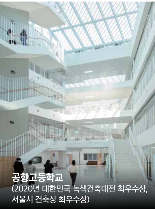
공항공등학교 (2020년 대한민국 녹색건축대전 최우수상, 서울시 건축상 최우수상)