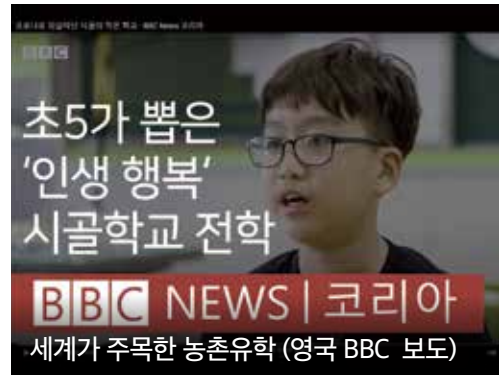
초5가 뽑은 '인생 행복' 시골학교 전학