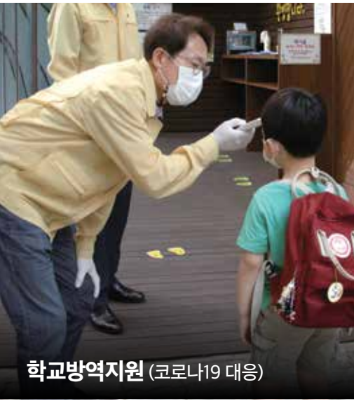
학교방역지원 (코로나19 대응)

92% 7대 약속, 31개 공약사업, 100개 세부과제 중 92개 이행 완료 | 나머지 과제도 정상 추진 또는 일부 추진