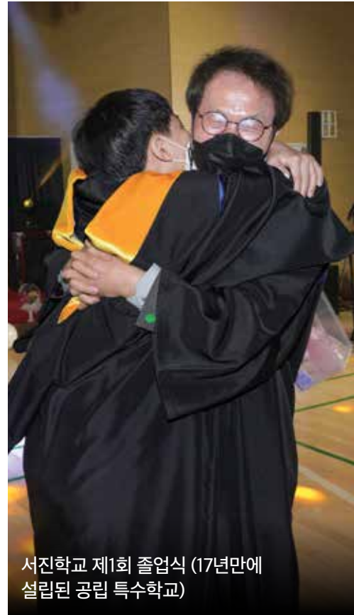
서진학교 제1회 졸업식 (17년만에 설립된 공립 특수학교)